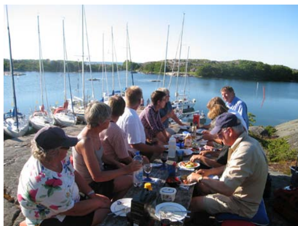
Gemensam middag på Österskär.

Redan från början var det planerat med en extra dag på Österskär så det blev sov morgon och en vandring runt ön som inledde dag två. I det fortsatt strålande vädret pysslade sedan var och en med sitt innan vi samlades uppe på berget för att vid långbordet äta tillsammans vad som tillagats i respektive båt. Ännu en stilla kväll med utsikt över en fantastisk skärgård och trevlig samvaro avslutade besöket på detta smultronställe.