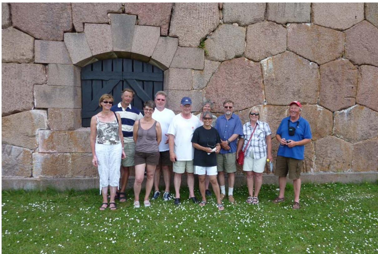
Nästan alla deltagare vid ruinen i Bomarsund.

Hittills hade vi haft vind, om än ibland lite svag, men på nästa etapp låg fjärdarna i stort sett blanka, så på lite skilda vägar tog vi oss för motor mot Bomarsund. Där var det ganska trångt för första gången sedan Arholma, men alla lyckades klämma sig in vid bryggan. En rundvandring i ruinerna av den före detta ryska fästningen, som erövrades och sprängdes 1854 av en engelsk/fransk eskader, gav välbehövlig motion och möjlighet till ett gruppfoto i annorlunda miljö. Senare samlades vi för att grilla och gemensam måltid vid grillen som är uppställd i anslutning till hamnen. Kvällen blev som vanligt sen och trevlig.