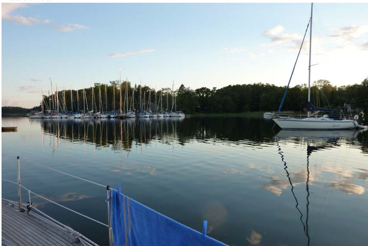
Österhamnen på Arholma med två eskadrar.