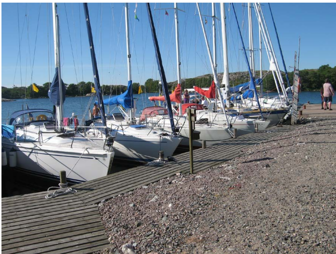
Eskadern på Österskär.

Morgonen därpå fortsatte vi österut i ganska svaga och växlande vindar. Nästan genast passerades Ledsund, där historien tränger sig på från en tid då Sverige utkämpade många sjöslag. Några båtar passade på att göra ett hastigt strandhugg i Degerby för att komplettera förråden innan vi styrde kosan mot dagens mål som var Sottunga. Vi hade siktat in oss på att äta på den lilla mysiga krogen Strandhugget, men det visade sig att de upphört med matservering, så istället gick vi i samlad tropp något hundratal meter till en betydligt modernare servering. Maten var det inget fel på, men atmosfären går inte att jämföra med Strandhugget.