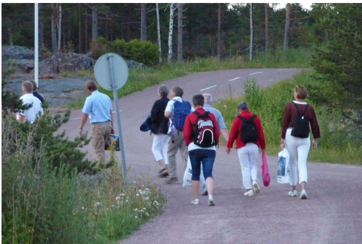
Mycket att släpa på efter en färjetur.

Vidare gick vi för motor i mycket svag vind förbi den imponerande Dånö Gamlan och i den betagande vackra inre leden mot sydväst. När vattnen öppnade sig kom en lätt vind och några båtar försökte med seglen. Ganska snart dog den ut och eftersom planen var att "tura" var alla tvungna att åter använda gjutjärnsgenuan för att hinna. Lagom till att vi skulle lägga till i Käringsund kom vinden tillbaka. I samlad tropp gick vi till färjan, biljett ingår i hamnavgiften. På vägen till Grisslehamn var det omöjligt att få bord, men på återresan var det gott om plats och vi kunde alla samlas för avslutningsmiddag. I den ljusa sommarnatten vandrade vi så tillbaka till båtarna med ganska så tung packning.