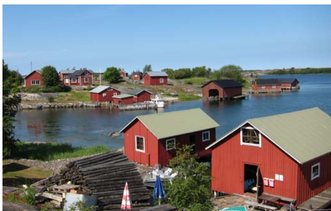
Bastun och sjöboden i förgrunden på Österskär.